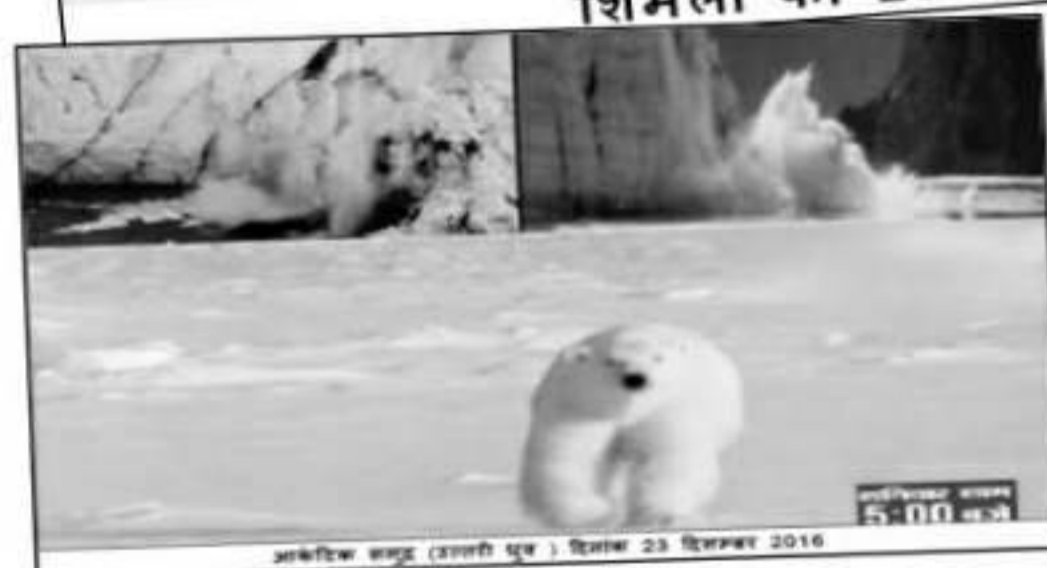
आर्कटिक समुद्र (उत्तरी ध्रुव) शिमला 23 दिसम्बर 2016

चेतावनी जिसे नजरअंदाज करना इस धरती के लिए महाविनाश की वजह बन सकता है। सर्दियों का मौसम हमेशा के लिए गायब हो जाएगा और ये धरती किसी रेगिस्तान की तरह झुलसने लगेगी।