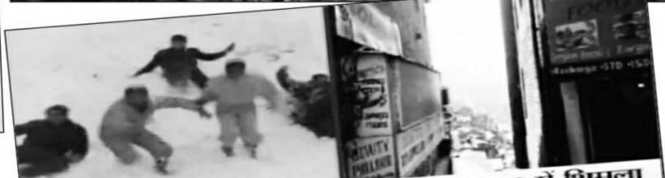
दिसंबर 2015 में शिमला