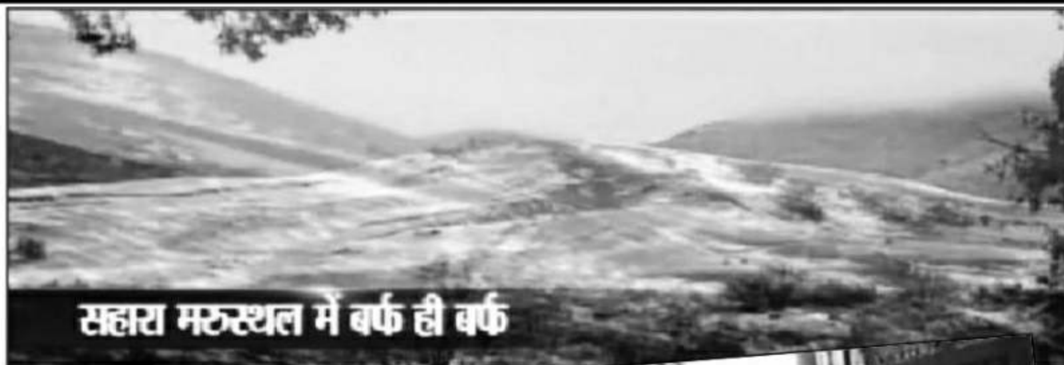
सहारा मरुस्थल में बर्फ ही बर्फ

यह सुनकर आप को अजीब सा लगेगा कि दुनिया का सबसे बड़ा रेगिस्तान, बर्फीस्तान बन गया। यह बात सहारा मरुस्थल की है जिसे देखकर मौसम विज्ञानियों के भी पसीने छूट रहे हैं। इस