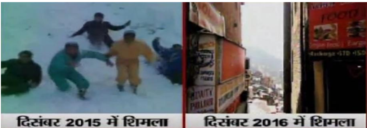
शिमला की 2015 व 2016 की स्थितियां

इसका मकसद आपको डराना नहीं बल्कि आगाह करना है | कुदरत की सबसे बड़ी अनहोनी से बचाना है | क्योंकि धरती के सबसे बड़े बर्फीस्तान में जो महासंकट आया है | उसकी मार से दुनिया में कोई नहीं बच पाएगा | क्या है ये महासंकट और इससे दुनिया को कितना बड़ा खतरा है जो इस धरती पर मंडरा रहे उस महासंकट का सबसे बड़ा सबूत हैं, जिसने हिंदुस्तान से लेकर अमेरिका तक सबके होश उड़ा दिए हैं | ये अंतरिक्ष से ली गई सैटेलाइट इमेज है |