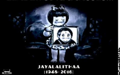
Check out all Annual Topicals since 1976 on our official App "4 Arun World" on Play Store & iTunes