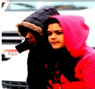
सर्द हवाएं चलने से कई लोग घरों में रहे, जबकि कई लोगों ने मौसम का लुफ्त उठाया।