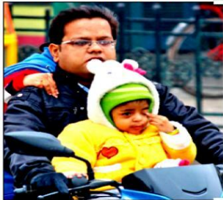
लोग मंगलवार को बच्चों को गर्म कपड़ों से लैस करने के बाद साथ लेकर बाहर निकले।