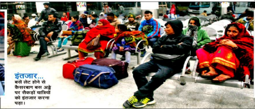
इंतजार... बसें लोट होने से कैसलबाग बस अड्डे पर सैकड़ों यात्रियों को इंतजार करना पड़ा।